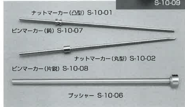
ナットマーカー(凸型) S-10-01