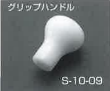
グリップハンドル

術中のX線撮影で正しい位置、方向を確認し、スクリュー挿入前にピンマーカーの長さからペディクルスクリューの長さを決定します。