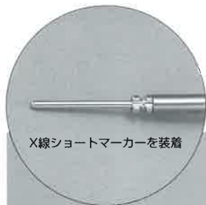
X線ショートマーカーを装着