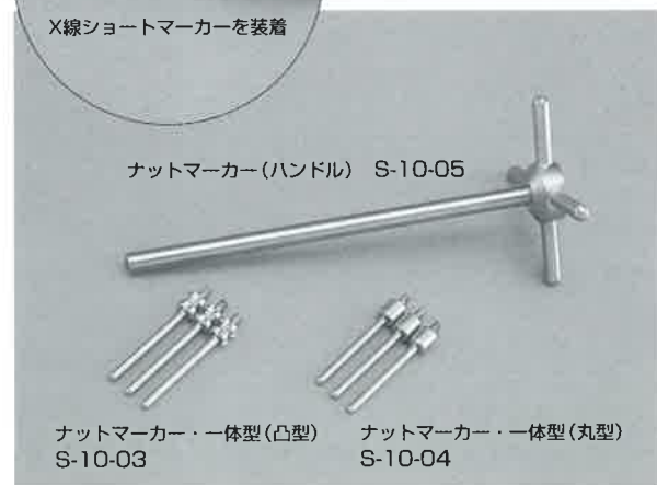
ナットマーカー(ハンドル) S-10-05